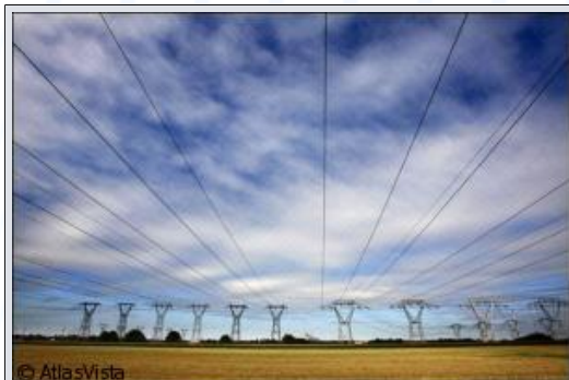
Lignes haute tension sur le site de distribution du Réseau français de transport d'électricité (RTE), filiale d'EDF, à Villejust, le 31 août 2006

PARIS (AFP) - Le marché de l'énergie s'est modestement ouvert en France depuis sa libéralisation totale dimanche, avec 524 contrats "pour des offres d'énergie à prix de marché" signés lundi par Gaz de France, et 1.160 contrats souscrits auprès du fournisseur alternatif Poweo.